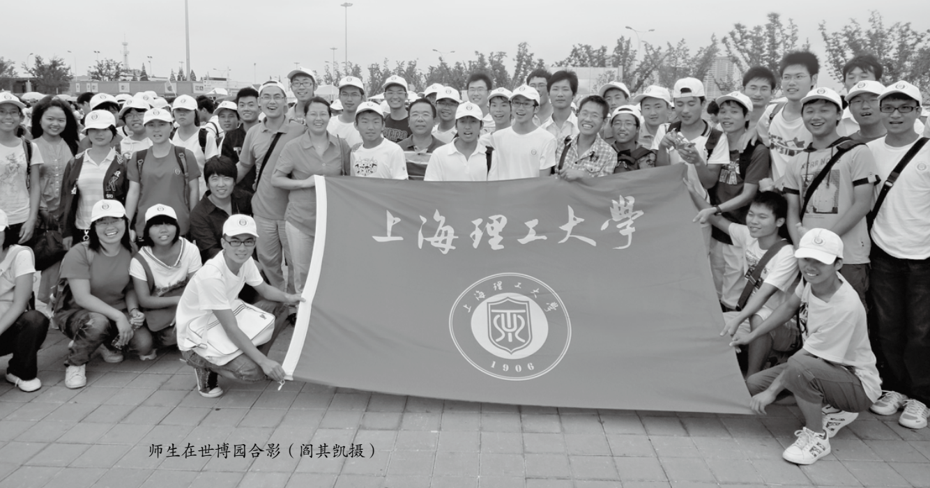
师生在世博园合影