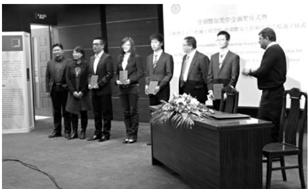
曼·胡默尔奖学金颁奖仪式

共识。根据计划，企业为每年遴选的一批学生为预备工程师，安排参加项目工作兼做毕业设计或课题研究，在生产线和各业务部门之间的轮岗，派出相关部门员工为企业指导老师，与我校老师共同指导学生实践。