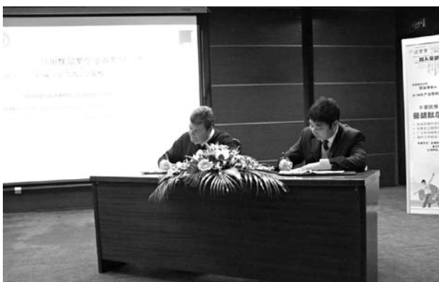
我校与曼·胡默尔滤清器贸易（上海）有限公司签订联合培养预备工程师协议

曼·胡默尔奖学金由曼·胡默尔滤清器贸易（上海）有限公司在我校设立，一期计划协议三年。在该奖项第一期计划实施的最后一年，校企双方深化合作，经友好协商，由设立奖学金拓展到联合培养人才，以校企合作、资源共享的形式，就预备工程师联合培养计划达成