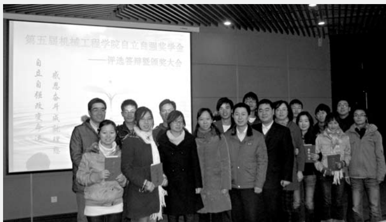
获奖同学与老师合影

历年来，机械工程学院“自立自强”优秀大学生的评选，在广大同学中树立了学习的榜样，增强了“用身边人教育身边人”的思想政治教育感染力，鼓舞广大同学在逆境中树立顽强拼搏、永不言弃的精神和勇气，鼓励大学生、尤其是贫困生把主要精力集中在学业与自身综合素质提升方面，焕发出自身内在的强劲动力，在精神上达到自我解困，在学院营造了奋发志气、刚健有为、感恩奉献的励志文化氛围。