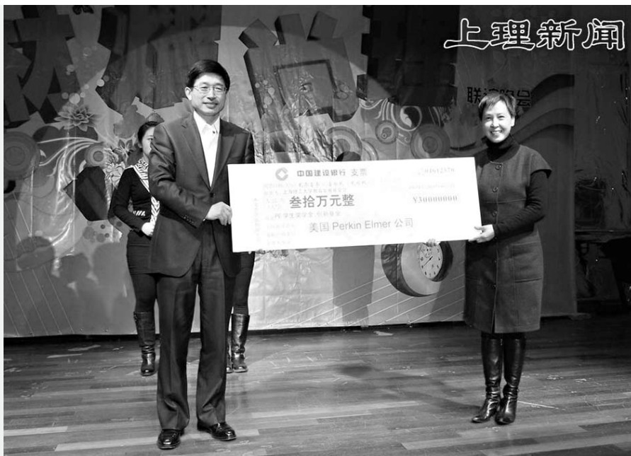
校教育发展基金会接受PerkinElmer公司捐赠

PerkinElmer学生奖学金、创新基金捐赠与颁奖大会后，与会领导、嘉宾与材料学院全体师生共同欣赏了一台精彩纷呈的师生联谊晚会。